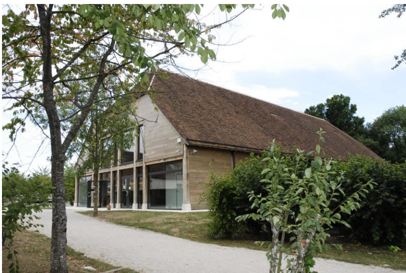
La grande Halle de Chamerolles