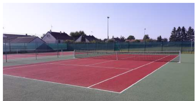
Nouveaux courts de tennis